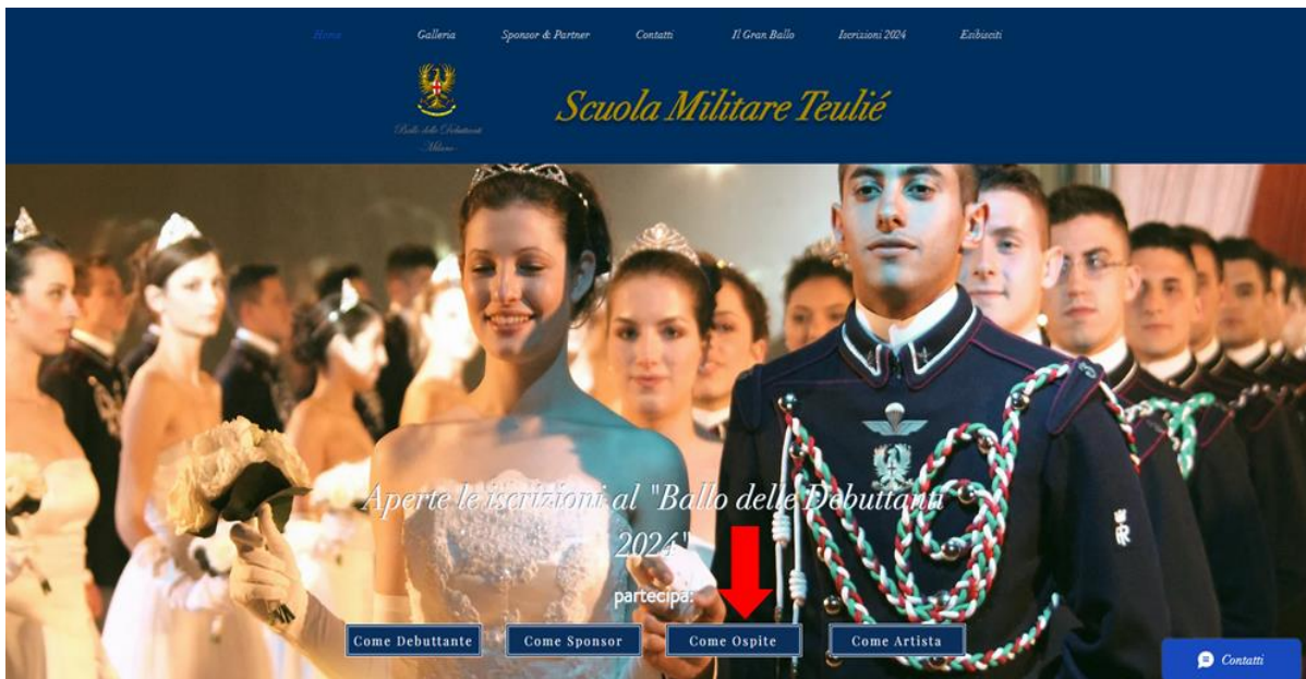
Immagine 3 Home del sito