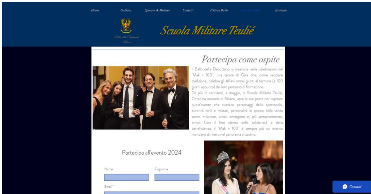
Immagine 4 Format per registrazione ospiti