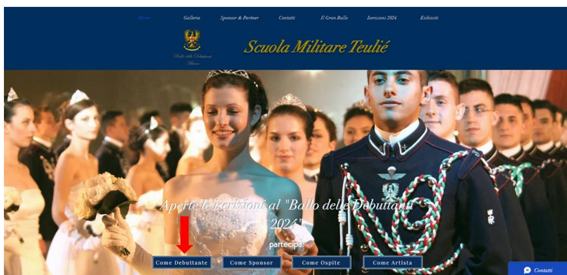
Immagine 2 Home del sito