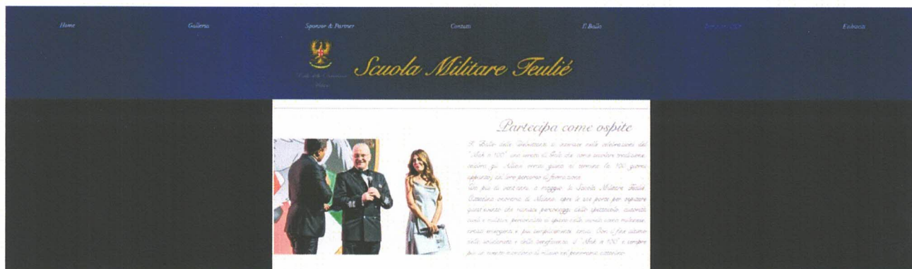
Immagine 3 Format per registrazione ospiti