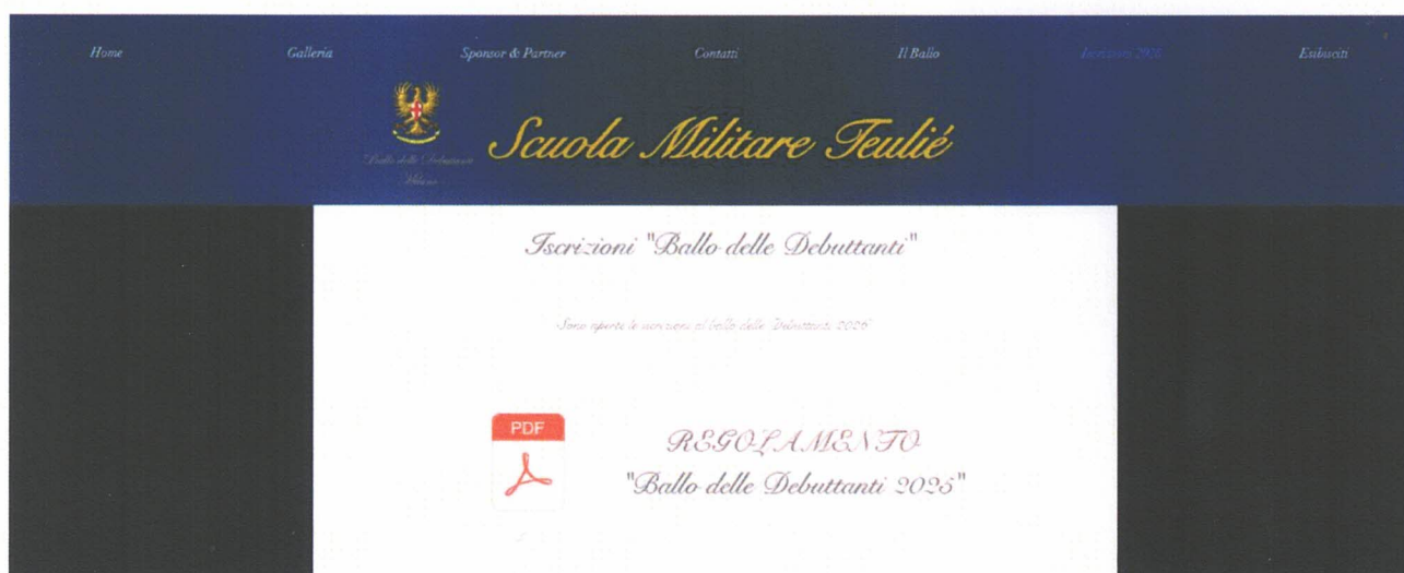
Immagine 2 Format da compilare per registrazione debuttanti