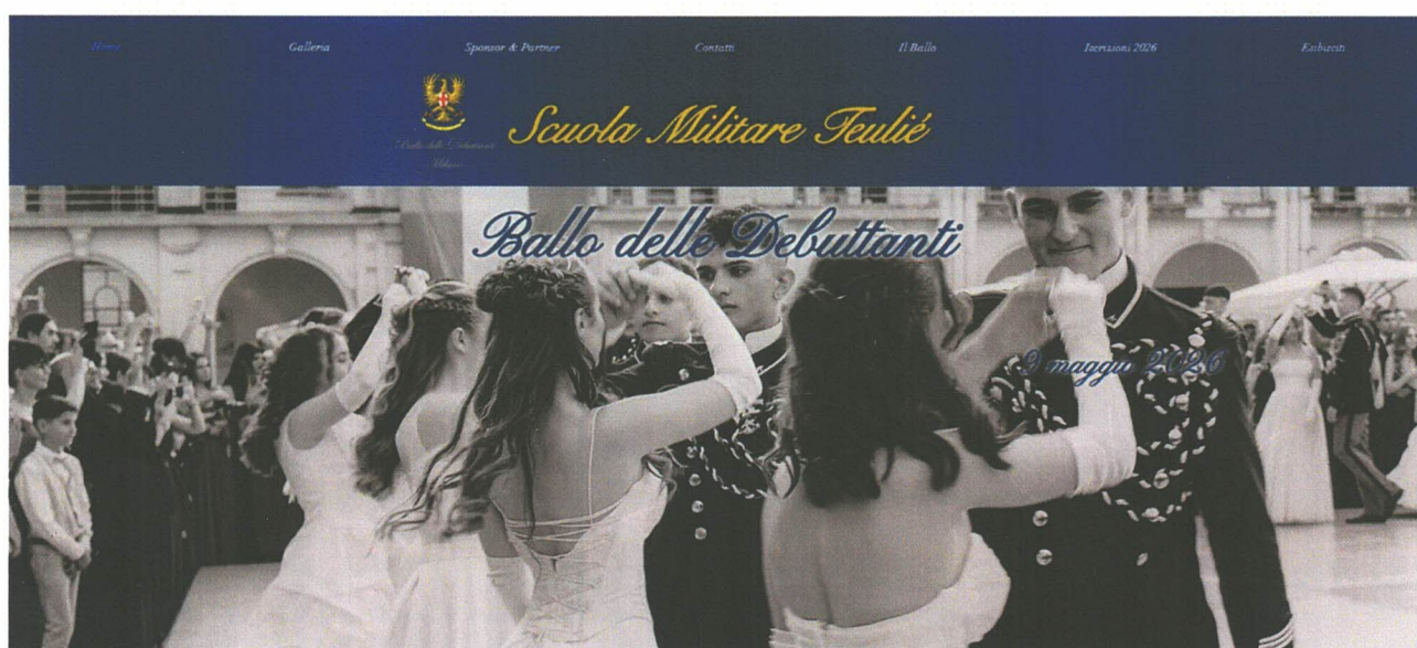
Immagine 1 Home del sito